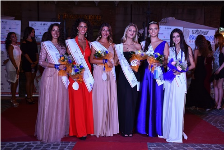
Le sei fasce