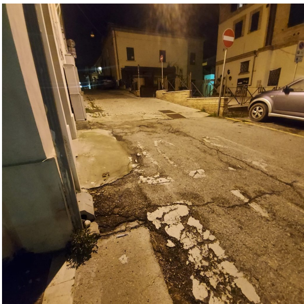
Via San Francesco d'Assisi Giulianova