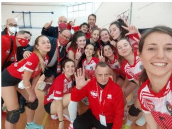
02 Squadra pallavolo CUS UniTe

Anche il rettore dell'Università di Teramo Dino Mastrocola e il rettore dell'Università di Macerata Francesco Adornato hanno assistito alla prima partita di pallavolo del CUS UniTe sul campo del CUS Macerata, che si è svolta