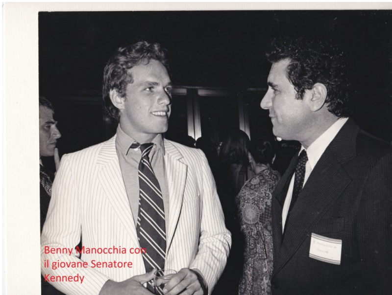
Benny Manocchia e il Senatore Kennedy

l'Italia e la renderanno ricca e bella daccapo. Per quanti mesi? Se lo chiedono in Italia, in Europa e anche negli Stati Uniti. Quanto durerà questo cosiddetto "governo"? Tanto quanto durerà la pazienza dei ministri, che comunque sono partiti in questa avventura guardandosi in cagnesco. Poi qualcuno dirà che così le cose non vanno e bisogna avere un "nuovo" governo.