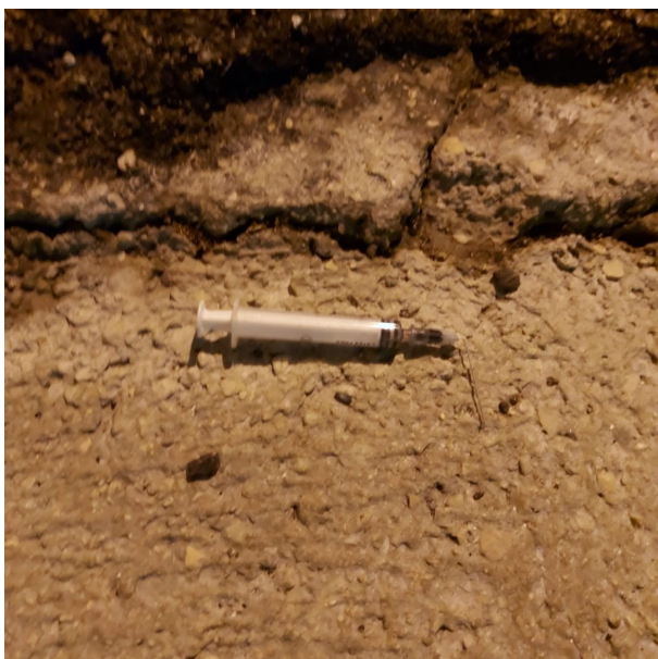
Via San Francesco d'Assisi Giulianova