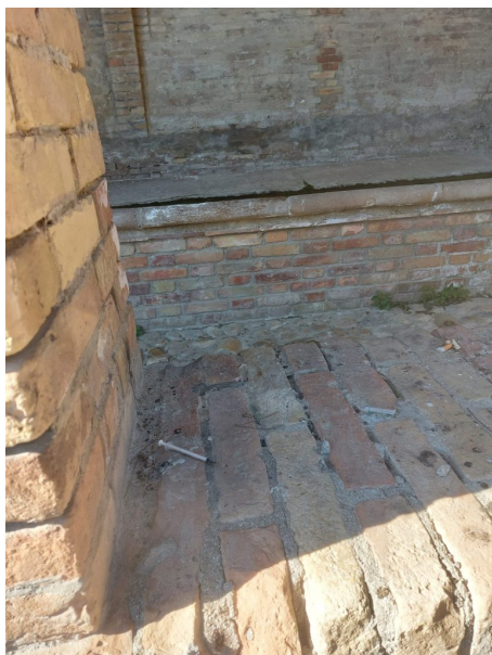
Siringhe sulla Salita Monte Grappa