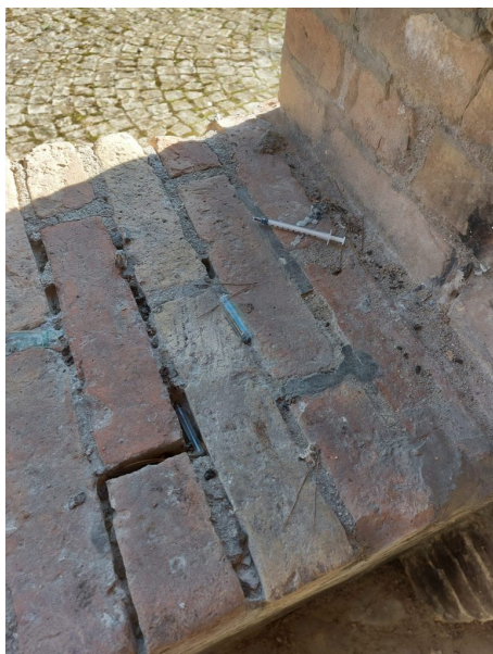
siringhe sulla salita Monte Grappa

Pubblichiamo alcune foto inviate dai nostri lettori sulla presenze di alcune siringhe abbandonate nei pressi delle "fontanelle" lungo la salita Monte Grappa