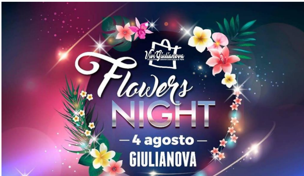
logo giulianova flowers night

GIULIANOVA - Dopo il successo della "Giulianova Summer Night" del 14 luglio, sabato 4 agosto arriva la " Giulianova Flowers Night " evento, sempre, organizzato dai commercianti del lido.