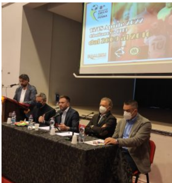
Bellissima mattinata di sport e impegno sociale, oggi al Kursaal. Presentato l'VIII Torneo "Memorial Emilio Della Penna" e premiati il dottor Paolo Calafiore e l'ex portiere della Nazionale e dell'AS Roma Franco Tancredi. E' iniziata attorno alle 11,