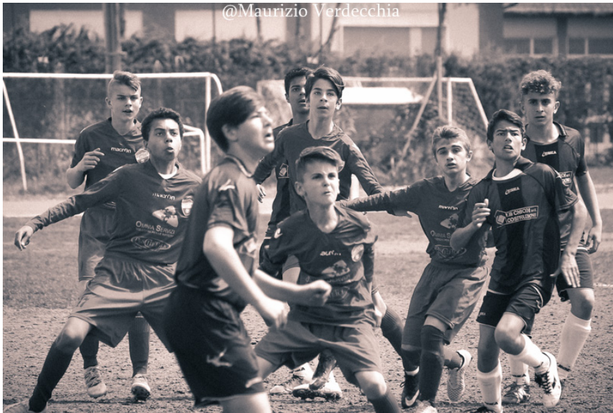
Torneo Emilio Della Penna

Le squadre, composte da bambini dai 7 ai 15anni, sono le seguenti: Delfini Biancazzurri Pescara, Alba Adriatica, Curi Pescara, Piccoli Giallorossi Giulianova, Valle del Vomano, River Chieti, Sambenedettese Calcio, Fenice Academy Avezzano, Città di Ciampino Roma, Lisciani Teramo, Virtus Scerne 2004, Barberini, Gladius Pescara, Academy Civitanovese, Teramo Calcio, Alba Montaureri, L'Aquila Calcio, Virtus San Nicolò Teramo, Accademia Calcio Pescara, Sant'Omero Palmense, Pineto Calcio, Torricella Sicura, Pro Tirino Pescara, Universal Roseto degli Abruzzi, Montespaccato Roma, Imolese 1919, Diavoli Rossi Taranto, Vigor Senigallia, Grifone Monteverde Roma, Riccione Calcio, Medaglie d'Oro Barletta, Sporting Caserta e D'Annunzio Marina Pescara. I baby calciatori si sfideranno per tre giorni di seguito, dal 29 aprile al 1 maggio, al Rubens Fadini, Castrum - Tiberio Orsini, La Pelota di Case di Trento, Green Point di Giulianova e Il Triangolo di Cologna Spiaggia. Le squadre provenienti da fuori regione sono state fatte sistemare negli hotel Cesare, Fabiola, Sea Park e Smeraldo.