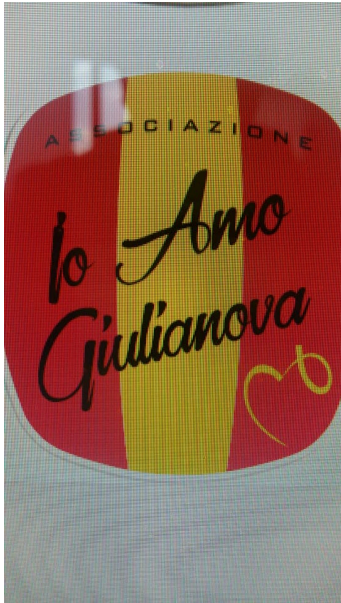
Io Amo Giulianova