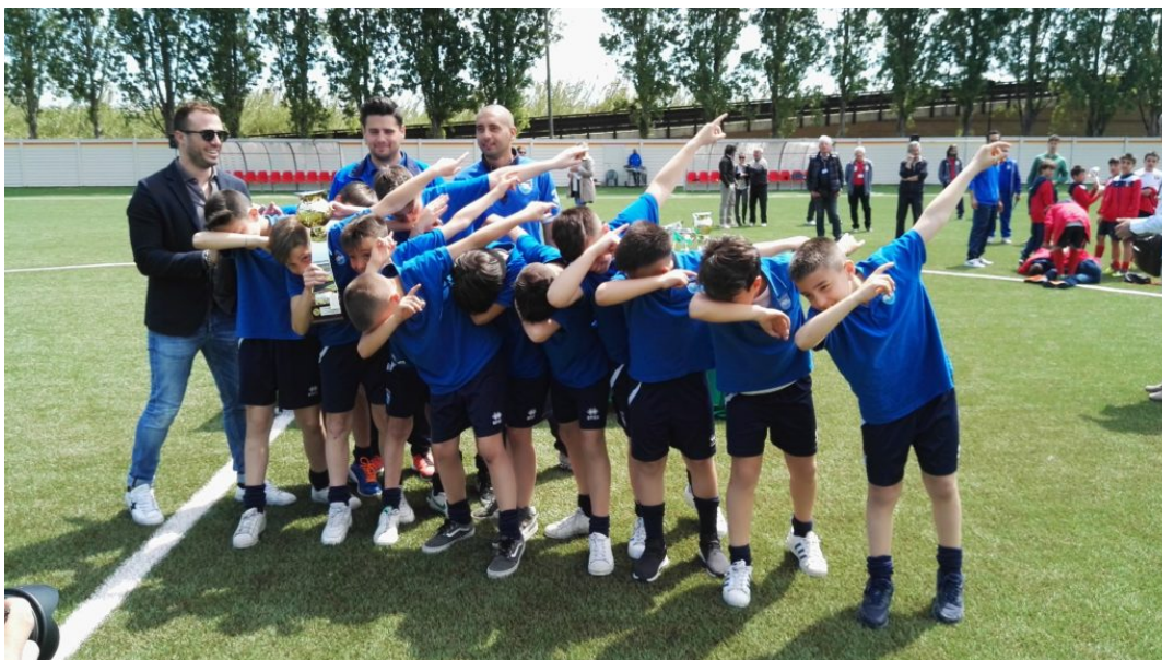
Torneo Emilio Della Penna

Le squadre, composte da bambini dai 7 ai 15anni, sono le seguenti: Delfini Biancazzurri Pescara, Alba Adriatica, Curi Pescara, Piccoli Giallorossi Giulianova, Valle del Vomano, River Chieti, Sambenedettese Calcio, Fenice Academy Avezzano, Città di Ciampino Roma, Lisciani Teramo, Virtus Scerne 2004, Barberini, Gladius Pescara, Academy Civitanovese, Teramo Calcio, Alba Montaureri, L'Aquila Calcio, Virtus San Nicolò Teramo, Accademia Calcio Pescara, Sant'Omero Palmense, Pineto Calcio, Torricella Sicura, Pro Tirino Pescara, Universal Roseto degli Abruzzi, Montespaccato Roma, Imolese 1919, Diavoli Rossi Taranto, Vigor Senigallia, Grifone Monteverde Roma, Riccione Calcio, Medaglie d'Oro Barletta, Sporting Caserta e D'Annunzio Marina Pescara. I baby calciatori si sfideranno per tre giorni di seguito, dal 29 aprile al 1 maggio, al Rubens Fadini, Castrum - Tiberio Orsini, La Pelota di Case di Trento, Green Point di Giulianova e Il Triangolo di Cologna Spiaggia. Le squadre provenienti da fuori regione sono state fatte sistemare negli hotel Cesare, Fabiola, Sea Park e Smeraldo.