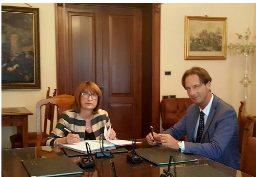
Firma patto sicurezza. A sx il prefetto di Teramo Patrizi e a dx il sindaco Mastromauro

A due sole settimane di distanza dal perfezionamento del Patto per l'attuazione della sicurezza urbana, siglato congiuntamente lo scorso 6 giugno dal prefetto di Teramo Graziella Patrizi e dal sindaco Francesco Mastromauro, la Giunta ha approvato il progetto per il potenziamento del sistema integrato di videosorveglianza urbana approntato sollecitamente dall'Ufficio sistemi informativi del Comune.