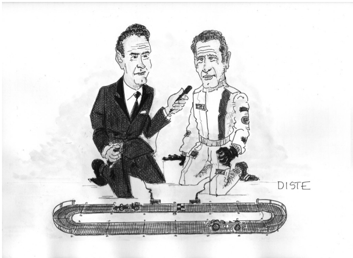
(C) vignetta di Vladimiro Di Stefano