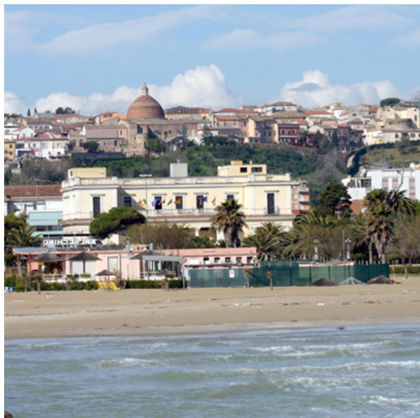
USA. Ricordi del primo dopoguerra a Giulianova con una finestra aperta alla crisi americana

USA. 19 novembre 2009. Caro Direttore, sei giovane per ricordare l'Italia dell'immediato dopoguerra, quando per "portare pane" sul tavolo o acquistare ciabatte per i figli gli italiani, molti italiani, erano costretti a mezzucci, piccoli imbrogli, a cercare qualcosa di diverso dal vivere civile. Io ricordo qualcosa anche se ero molto piccolo. I cosiddetti alleati venivano su dal sud Italia, i loro carri armati si fermavano sotto gli alberi della strada che porta alla Madonna dello Splendore, rovinavano il pavimento del Corso e appestavano l'aria con i loro ranci creati a base di margarina, penso: un puzzo tremendo. Ai ragazzi di Giulianova i soldati davano cioccolatini, sorrisi e qualche parola in italiano. L'Italia cercava di riprendersi, tornavano le fiere, le sagre. Il 22 aprile per noi era qualcosa di indimenticabile. Mortaretti, bande, noccioline americane in buste a mezza lira, processioni e un'aria di festa che avevamo dimenticato negli anni precedenti, preoccupati dalle bombe sulle nostre case e da una fame tremenda.