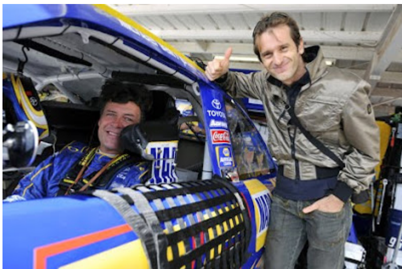
Pubblichiamo, con piacere, questo interessante reportage di Lino Manocchia da Smirne (Florida)