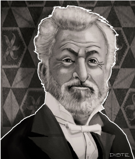
Gaetano Braga musicista