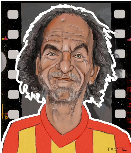
Lucio Merlo fotografo