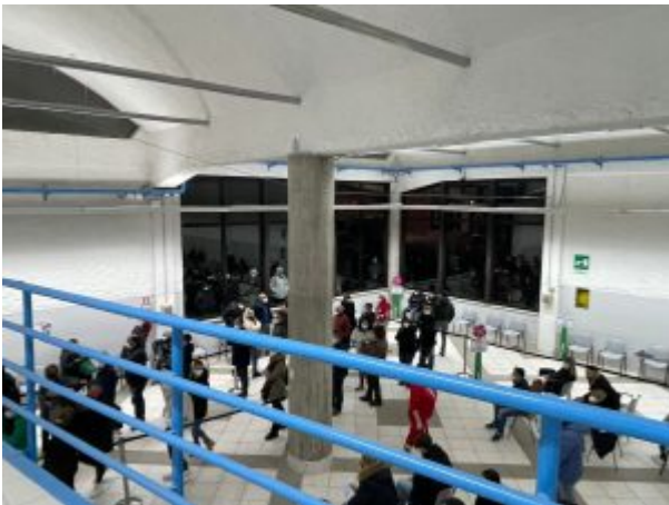
Hub Vaccinale di Teramo