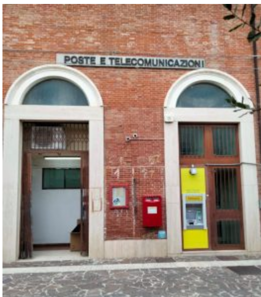
L'ufficio postale di Civitella del Tronto