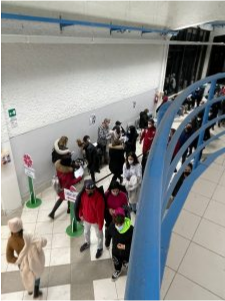
Hub Vaccinale di Teramo