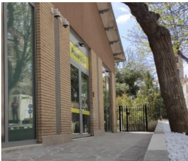
L'ufficio postale di Cellino Attanasio