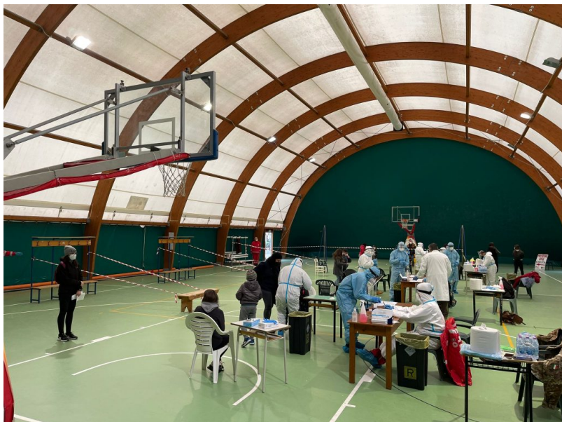
Palacastrum - controlli Covid

La campagna di testing Covid che si è conclusa ieri ha fatto registrare la partecipazione di 20.162 studenti su una popolazione di 32.213 unità su tutto il territorio provinciale. Ha partecipato dunque allo screening il 62,5% di coloro che frequentano le scuole, dalle elementari alle superiori, il target richiesto dal governo. Dei giovani che si sono sottoposti a tampone, 564 sono risultati positivi, pari al 2,79% della popolazione che ha partecipato alla campagna, lo 0,2% sopra la media regionale.