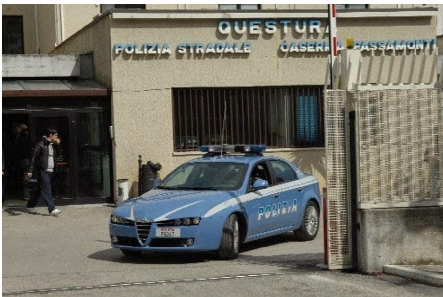
Polizia Questura di Teramo

Nella mattinata del 7 gennaio, personale della Squadra Mobile della Questura di Teramo, hanno dato esecuzione ad una ordinanza di misura cautelare del divieto di avvicinamento alla coniuge ed ai luoghi abitualmente frequentati dalla stessa, emessa a carico di un uomo della provincia di Teramo dal G.I.P. presso il Tribunale di Teramo, Dott. M. Procaccini, su richiesta del P.M. D.ssa F. Zani. Il provvedimento è scaturito a seguito della denuncia presentata dalla donna alla fine del mese di dicembre scorso, al culmine di una serie di episodi di maltrattamenti commessi dal marito, spesso in stato di ubriachezza, con violenza e minacce come documentato ai numerosi interventi della Volante della Questura di Teramo effettuati presso l'abitazione dei coniugi su richiesta della vittima sin dal mese di marzo del 2021. L'indagato, oltre a non potersi avvicinare alla moglie ed ai luoghi frequentati dalla stessa, dovrà mantenere una distanza di almeno 1 km. Il provvedimento è stato esteso anche per proteggere i genitori della donna.