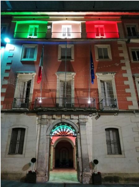
Prefettura di Teramo

Si rende noto che nel periodo compreso tra il 24 dicembre 2021 ed il 9 gennaio 2022 le Forze di Polizia (Questura, Arma dei Carabinieri e Guardia di Finanza) e le Polizie Locali dei Comuni di Teramo, Alba Adriatica, Ancarano, Campi, Castellalto, Civitella del Tronto, Controguerra, Corropoli, Crognaleto, Giulianova, Martinsicuro, Montorio al Vomano, Mosciano Sant'Angelo, Nereto, Pineto, Torricella Sicura e Tortoreto hanno effettuato sull'intero territorio provinciale, in base alle disposizioni impartite dal Comitato Provinciale per l'Ordine e la Sicurezza Pubblica, i controlli relativi al rispetto delle prescrizioni imposte dal D.L. 172/2021 di cui si riportano a seguire gli esiti in dettaglio. In particolare risultano: