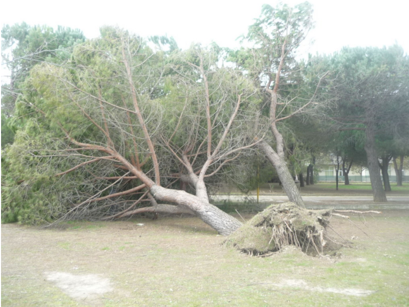
Maltempo - foto archivio