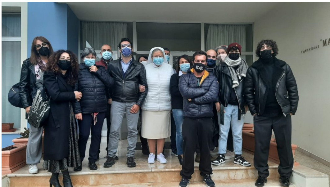
Progetto a Scerne di Pineto Casa Madre Ester