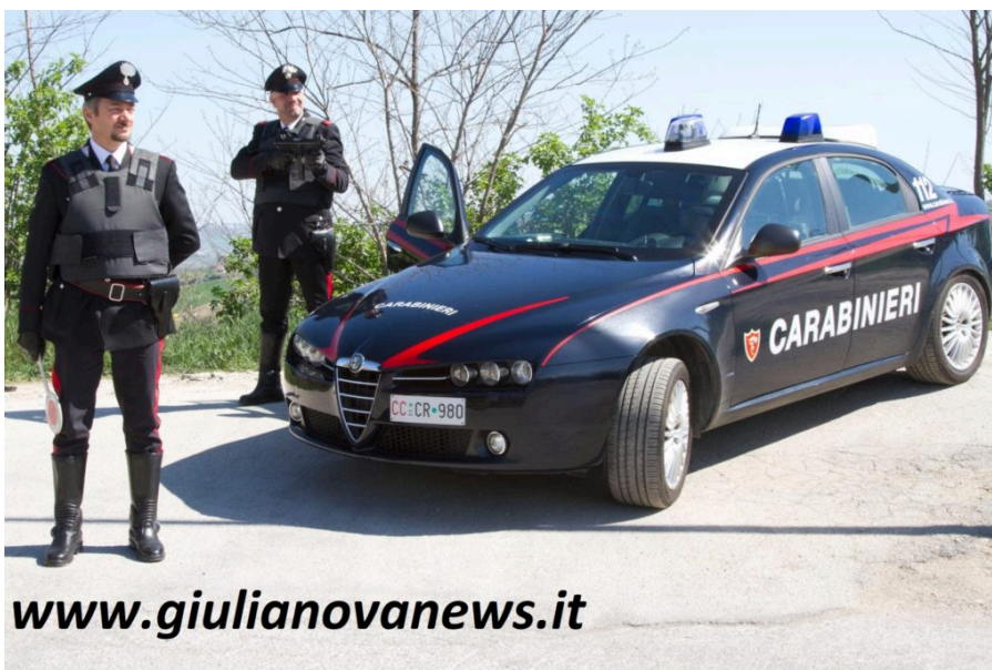
Carabinieri - foto archivio

Alba Adriatica. Prosegue senza soluzione di continuità l'impegno dei Carabinieri della Compagnia di Alba Adriatica volto a garantire sicurezza e legalità nella Val Vibrata.