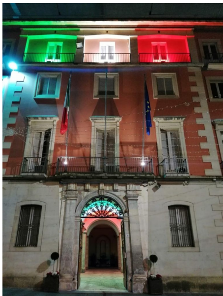
Prefettura di Teramo

Giovedì 4 novembre 2021, avranno luogo le celebrazioni in occasione della ricorrenza del “ Giorno dell’Unità Nazionale e Giornata delle Forze Armate ”.