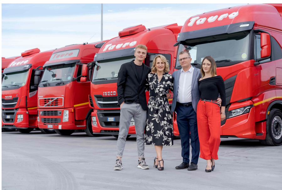
La famiglia Tauro