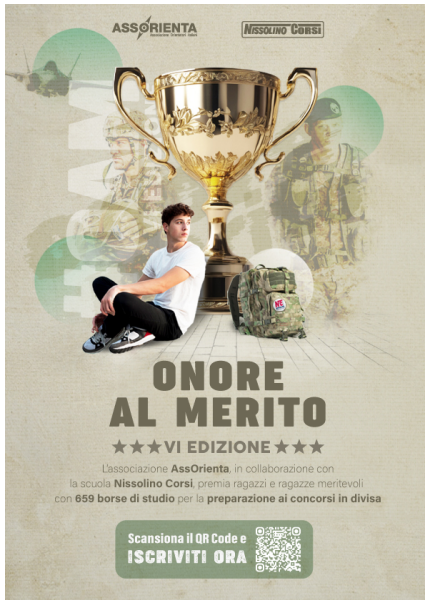
Onore al Merito REDAZIONALE

Celebrazioni religiose e civili per l'ottantesimo anniversario del Voto alla Madonna delle Grazie (2 febbraio 1944) e della liberazione del paese (21 giugno 1944) nel secondo conflitto mondiale