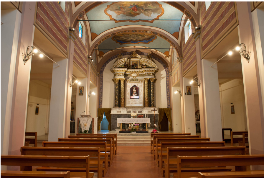
Madonna delle Grazie di Controguerra (2)