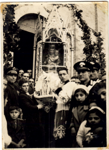
Voto alla Madonna delle Grazie 1944 A