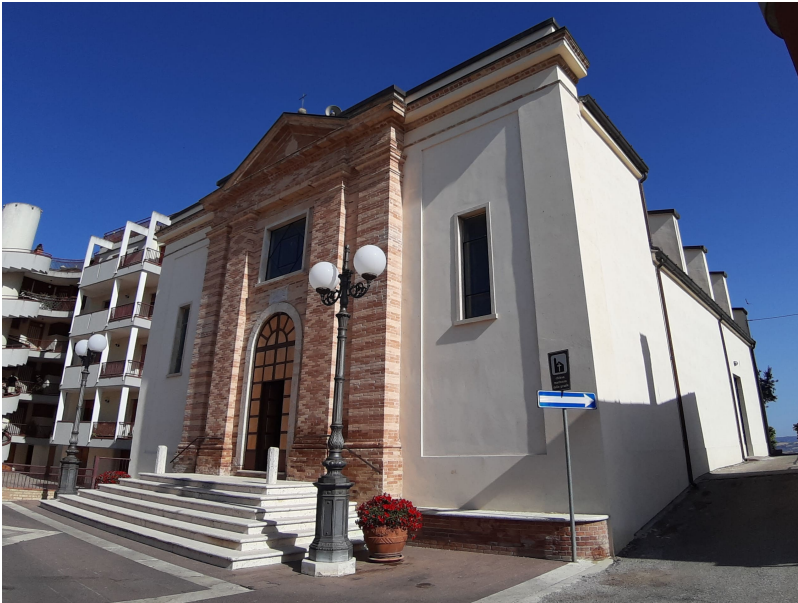
Madonna delle Grazie di Controguerra (3)