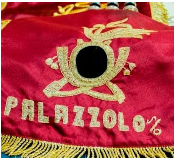
Fanfara bersaglieri Palazzolo Sull'Oglio

Celebrazioni religiose e civili per l'ottantesimo anniversario del Voto alla Madonna delle Grazie (2 febbraio 1944) e della liberazione del paese (21 giugno 1944) nel secondo conflitto mondiale