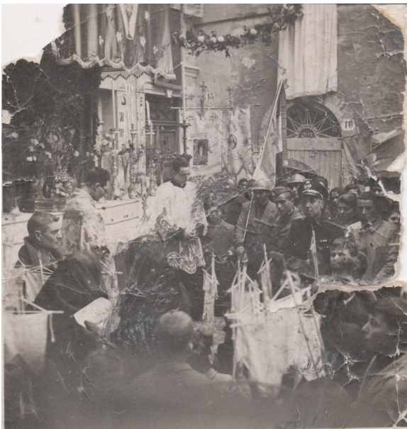
Voto alla Madonna delle Grazie 1944 B

Celebrazioni religiose e civili per l'ottantesimo anniversario del Voto alla Madonna delle Grazie (2 febbraio 1944) e della liberazione del paese (21 giugno 1944) nel secondo conflitto mondiale