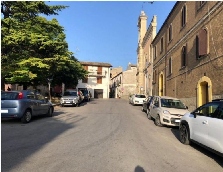
Piazzale antistante Santa Rita – Atri