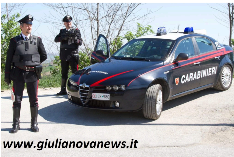
Carabinieri - foto archivio

I Carabinieri di Castelnuovo Vomano, durante un normale controllo della circolazione stradale, in piazza della Stazione, a Roseto degli Abruzzi, hanno fermato un cittadino inglese che aveva esagerato con la birra. L'uomo, inoltre, ha rifiutato di sottoporsi al previsto accertamento con etilometro e, pertanto, gli è stata ritirata la patente di guida.