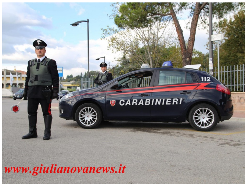
Carabinieri Foto Archivio

I Carabinieri della Compagnia di Teramo, nel quadro del costante impegno dell'Arma a tutela delle fasce più deboli della popolazione, hanno eseguito due misure cautelari emesse dal GIP presso il Tribunale di Teramo entrambe per il delitto di atti persecutori previsto e punito dall'art. 612 bis del codice penale. Nel primo caso si tratta di un uomo di Teramo di anni 38, gravato da precedenti specifici, nei cui confronti è stata eseguita un'ordinanza di applicazione della custodia cautelare in carcere poiché responsabile di atti persecutori nei confronti di una donna di cui si era invaghito. L'arrestato era già sottoposto al regime degli arresti domiciliari per lo stesso motivo, ma ciò non gli aveva impedito di minacciare attraverso i canali social la vittima e i testimoni che avevano riferito ai carabinieri le circostanze utili a ricostruire la vicenda attinente i pregressi atti persecutori. Proprio per tali motivi i Carabinieri hanno prelevato l'uomo dall'abitazione in cui scontava gli arresti domiciliari, per condurlo nel carcere di Lanciano, dove attualmente si trova a disposizione dell'Autorità Giudiziaria.