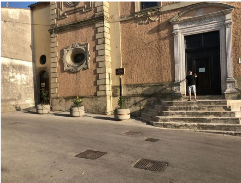
Santa Rita – Atri