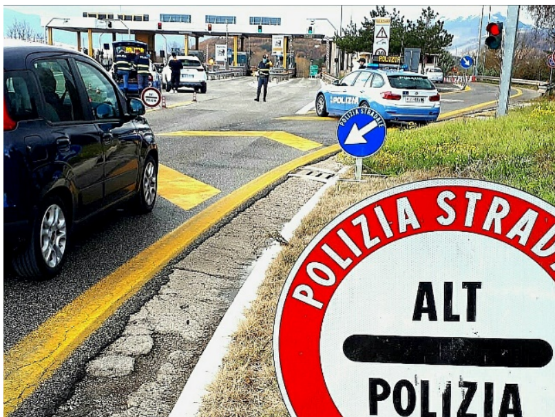
Polizia Stradale ARCHIVIO

La Squadra di polizia giudiziaria della Sezione Polizia Stradale di Teramo nella tarda mattinata di ieri, nei pressi del Casello "Val Vibrata" dell'A/14, ha fermato per controllo una un'autovettura Opel Astra: gli Agenti nel bagagliaio hanno rinvenuto un trasportino per animali con stipati 5 cuccioli di razza "Lagotto".