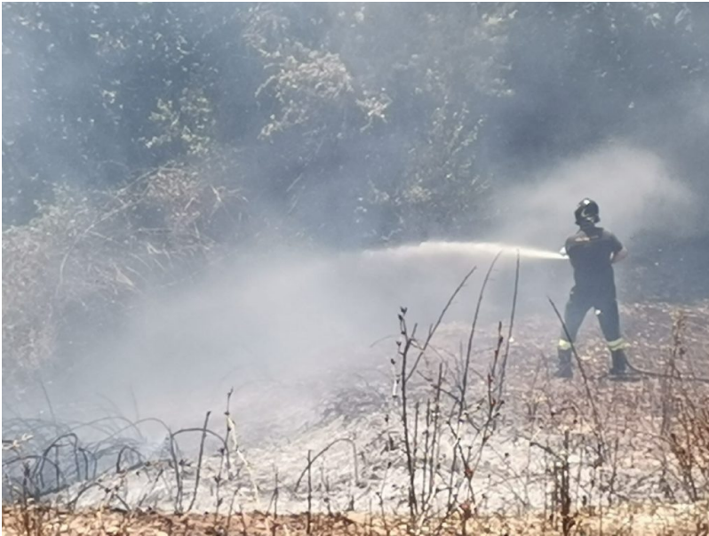
Vigili del Fuoco Teramo