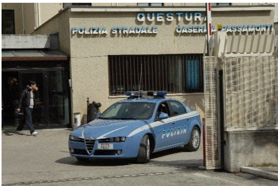
Polizia Questura di Teramo

Ritrovato dalla Polizia Stradale di Teramo il responsabile dell'incidente che domenica scorsa, sulla SS 81 per Ascoli Piceno, nel comune di Campoli, aveva urtato con la propria autovettura FIAT Panda un centauro che viaggiava regolarmente verso Ascoli Piceno, facendolo rovinare a terra in maniera violenta e procurandogli lesioni gravissime per le quali si rendeva necessario il trasporto presso l'Ospedale Civile di Teramo da parte del 118.