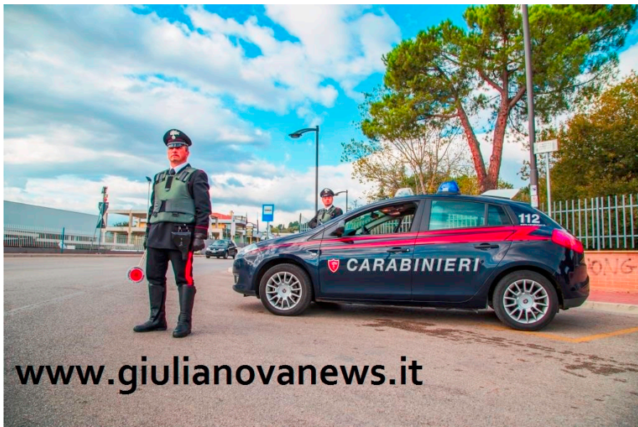
Carabinieri Foto Archivio

I Carabinieri di Pineto hanno identificato e denunciato alla competente autorità giudiziaria gli autori dei furti perpetrati l'11 luglio scorso su alcune auto in sosta nei pressi della Torre del Cerrano. Si tratta di due soggetti già noti ai Carabinieri, che sono stati identificati anche grazie alla collaborazione con la Polizia Municipale di Pineto, che ha fornito ai militari dell'Arma le immagini riprese da alcune telecamere comunali posizionate in zona, che hanno permesso così di identificare i due coniugi di Giulianova che avevano forzato le auto in sosta: si tratta di un uomo di 53 anni e di una donna di 51 anni. I due, infatti, la mattina dell'11 luglio scorso, avevano forzato le auto di alcuni turisti che avevano parcheggiato nelle vicinanze della Torre del Cerrano per recarsi alla vicina spiaggia. Il bottino complessivo era stato di circa trecento euro in contanti e di una carta di credito, poi utilizzata indebitamente dalla coppia di ladri per prelevare da uno sportello bancoposta di Giulianova altri duecento euro. I due dovranno rispondere alla Procura della Repubblica presso il Tribunale di Teramo, in concorso tra loro, dei reati di furto aggravato e danneggiamento.