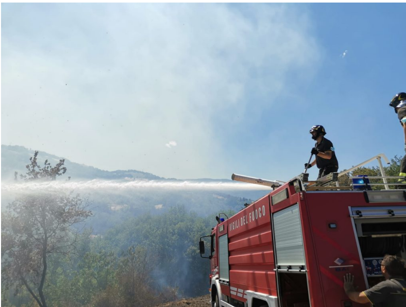
Vigili del Fuoco Teramo