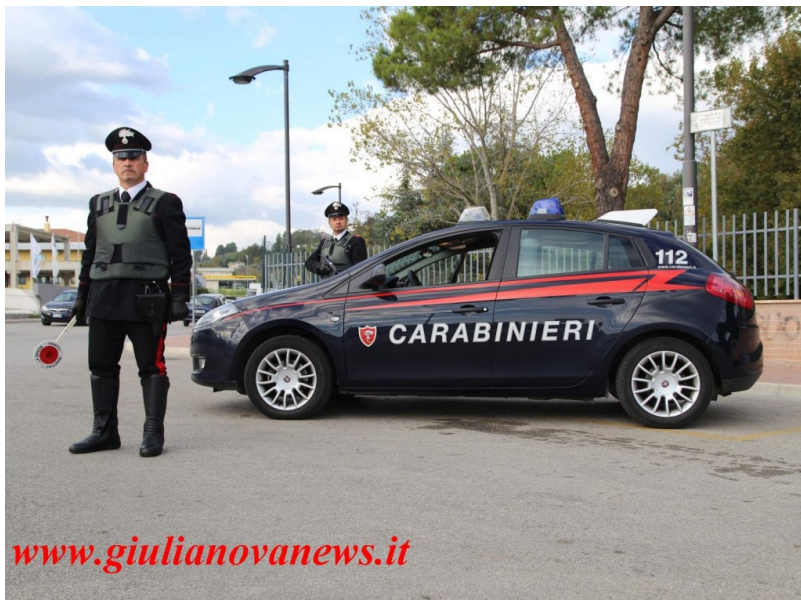
Carabinieri Foto Archivio

Un albanese 26enne, già agli arresti domiciliari nell'abitazione di Alba Adriatica e con l'applicazione del braccialetto elettronico, poiché ritenuto responsabile di alcuni reati commessi in questa Provincia nel 2019, si reso responsabile di atti violenti in famiglia. Le vittime, vistesi in pericolo, hanno immediatamente chiesto l'intervento dei Carabinieri chiamando il 112 per fare intervenire gli uomini della Compagnia di Alba Adriatica che hanno riportato la calma tra le parti, invitando le donne a trovare un'altra sistemazione. La vicenda è stata tempestivamente segnalata all'Ufficio di Sorveglianza di Pescara, oltre alla denuncia per maltrattamenti inviata alla Procura della Repubblica di Teramo, che ha revocato il beneficio disponendo la sua carcerazione. Il ragazzo, dopo la notifica del provvedimento restrittivo del magistrato di Sorveglianza, è stato tradotto presso la Casa Circondariale di Rebibbia in Roma.