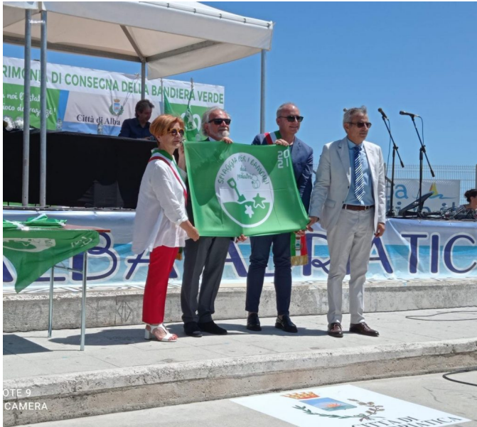
Bandiera Verde a Pineto