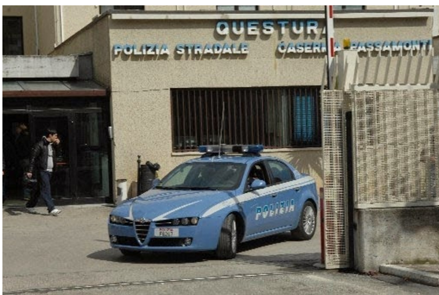
Polizia Questura di Teramo