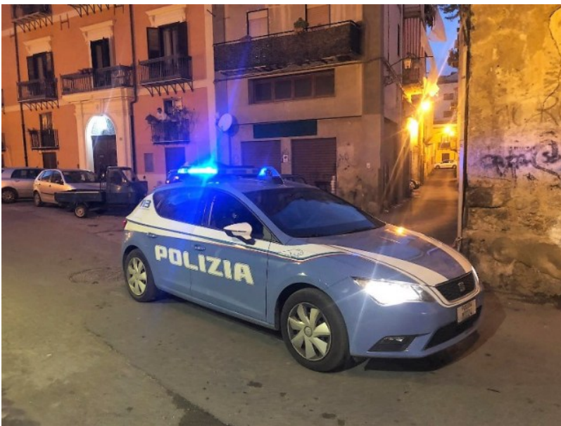
Teramo Polizia Foto Archivio

Dopo tempestiva e meticolosa attività di indagine gli Agenti del Commissariato P.S. di Atri hanno denunciato un 72enne residente in provincia di Roma per truffa commessa in danno di un cittadino di Atri, per un valore di 250 euro. Il malcapitato agli inizi del mese di marzo scorso, visionando un sito di vendita on line di diffusione nazionale di beni usati, si era messo in contatto con un ignoto venditore al fine di acquistare una macchina fotografica del valore di 600 euro. Dopo aver effettuato un bonifico bancario di acconto per 250 euro al sedicente venditore questi, non solo aveva cancellato l'annuncio, ma si era reso anche irreperibile all'utenza telefonica fornita, ovviamente risultata poi intestata ad altro soggetto. L'attività di indagine della squadra Anticrimine del Commissariato, anche attraverso concreti collegamenti con alcuni analoghi uffici della Capitale, ha permesso di identificare e denunciare in stato di libertà il 72 enne.