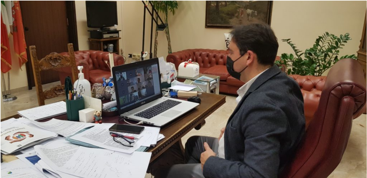
Il Sindaco di Teramo