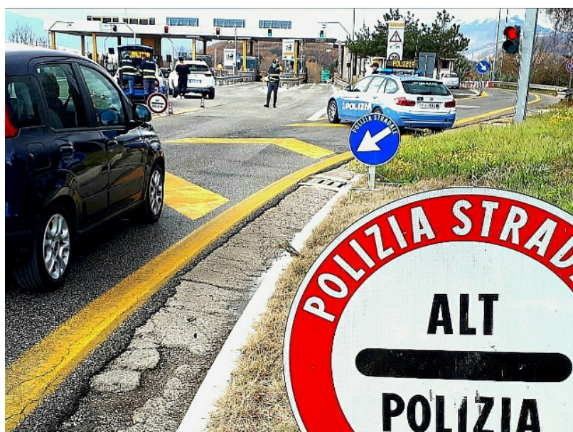
Polizia Stradale