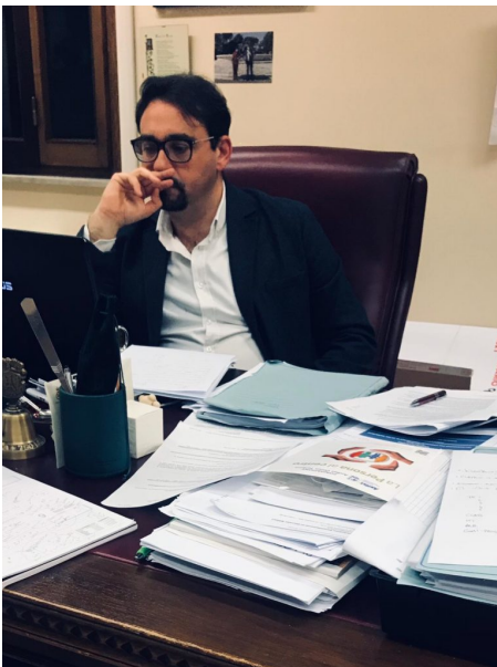
Il Sindaco di Teramo