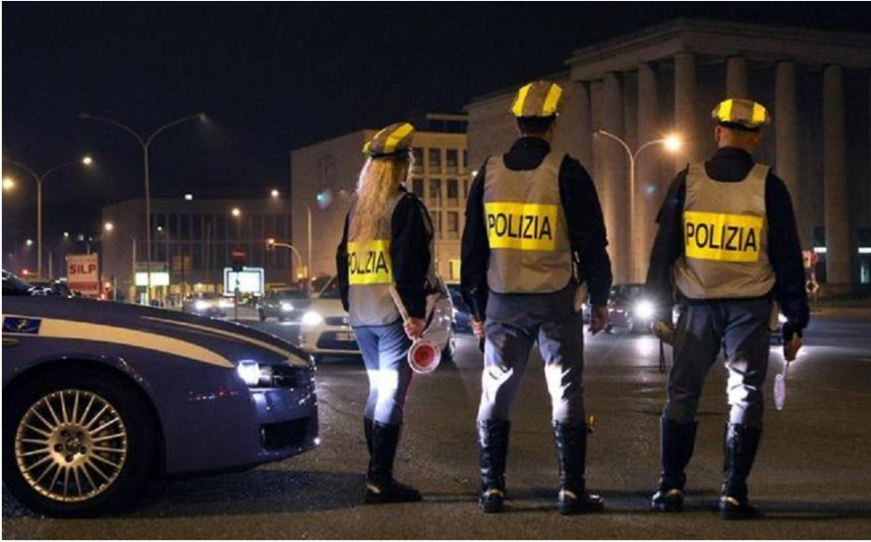
Polizia Stradale

Nonostante un generalizzato rispetto in questa provincia delle vigenti disposizioni per l'Area Rossa, non è mancato, ancora una volta, tra i più giovani il totale disinteresse per la prevenzione del virus.