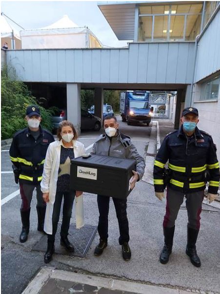
Polizia, scorta per la consegna dei vaccini in provincia di Teramo

Oggi ha avuto inizio la distribuzione dei vaccini presso i presidi ospedalieri di Atri, Giulianova e Sant'Omero, per la successiva fase di vaccinazione del personale sanitario degli stessi ospedali. Dopo il primo step di vaccinazione avvenuto in data 27 dicembre 2020 che ha interessato il personale medico ed infermieristico dell'Ospedale Civile di Teramo, anche in occasione di questa ulteriore programmazione il personale delle Forze dell'Ordine di questa Provincia è stato interessato per garantire il regolare svolgimento delle operazioni, per evitare turbative da parte di malintenzionati. Sono stati predisposti adeguati servizi anche di scorta durante il trasferimento dei vaccini anticovid-19 in partenza dall'Ospedale Civile di Teramo verso i suddetti altri nosocomi. Il ruolo delle forze di Polizia, in un momento così delicato, è ancora più importante per garantire la tutela della salute pubblica ed il rispetto delle regole imposte per prevenire il diffondersi dell'epidemia.