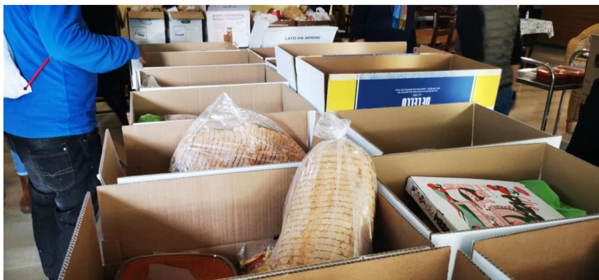
Befana solidale a Roseto

Continua l'impegno delle Guide del Borsacchio, insieme al Buon Vicinato, per