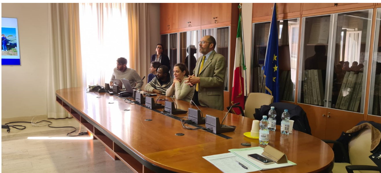
Prefettura di Teramo

IL PREFETTO STELO: "Ritengo fondamentale, nella nostra società democratica, che i migranti conoscano i propri diritti, doveri e gli strumenti di tutela a loro disposizione per chiedere aiuto in caso di sfruttamento lavorativo".