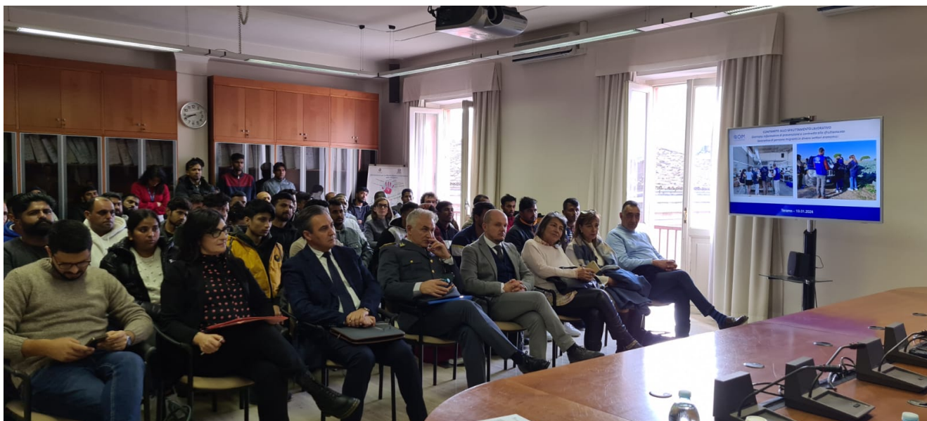
Prefettura di Teramo