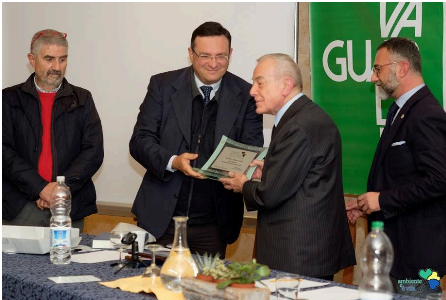
Gianni Letta