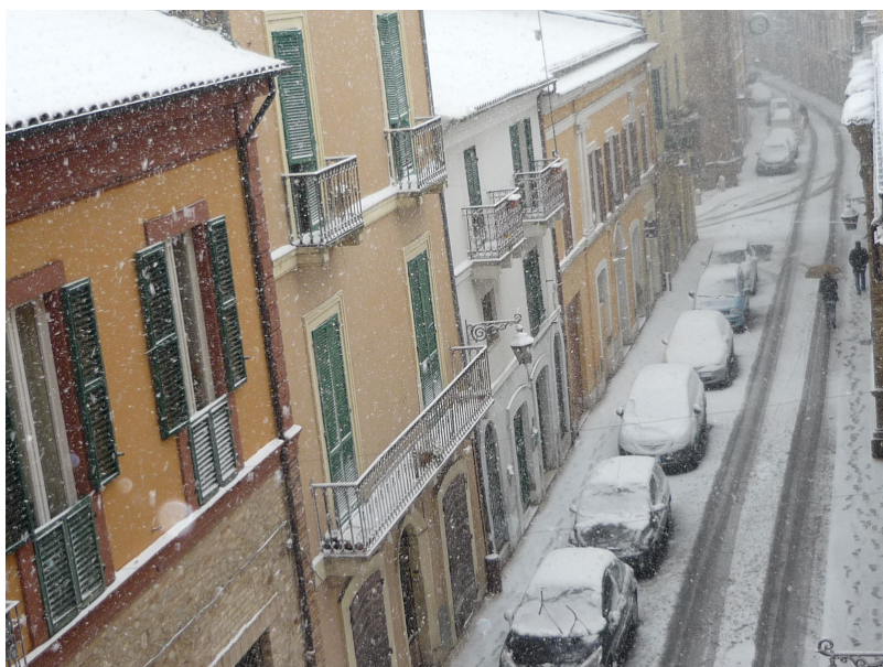
Corso Garibaldi sotto la neve.

Il Prefetto: “Ringrazio gli uffici e tutti i componenti del Comitato Operativo per la Viabilità che, anche quest’anno, hanno fornito una preziosa collaborazione per la stesura del piano”.