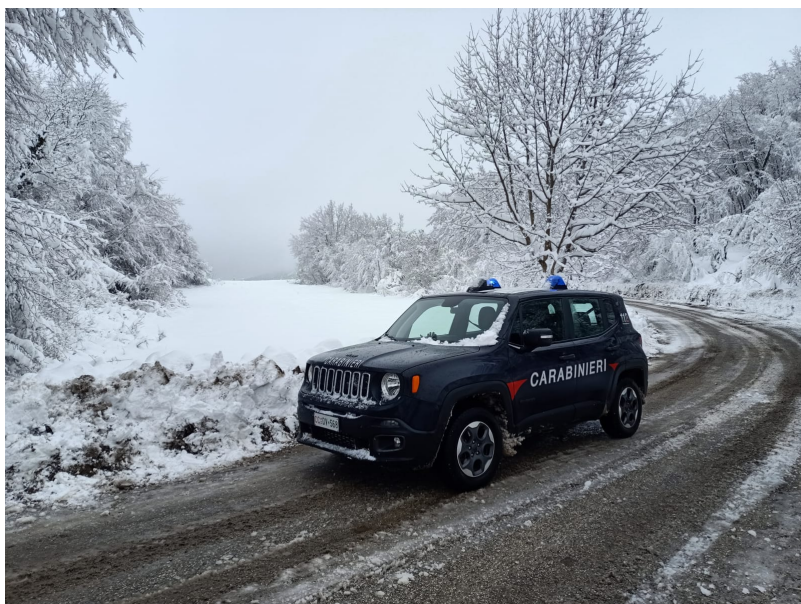
Carabinieri maltempo neve.