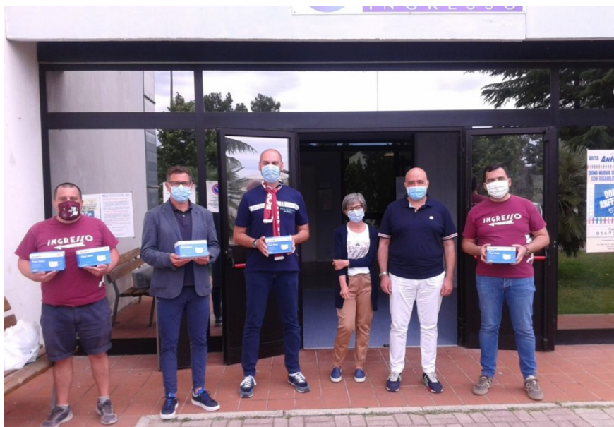
“Toro Club Anima Granata”, il club abruzzese nato nel 2015 dedicato al Torino calcio

Teramo, 23 giugno - E' sempre bello quando il calcio e la beneficenza si uniscono. E non solo il calcio ad alti livelli e della pay tv ma anche quello dei tifosi. Questo il senso dell'iniziativa di “ Toro Club Anima Granata ”, il club abruzzese nato nel 2015, dedicato al Torino Calcio , che ha donato alla Fondazione Anffas Onlus di Teramo 600 mascherine chirurgiche, in un momento così difficile, come quello che sta attraversando il paese a causa dell'emergenza Coronavirus.