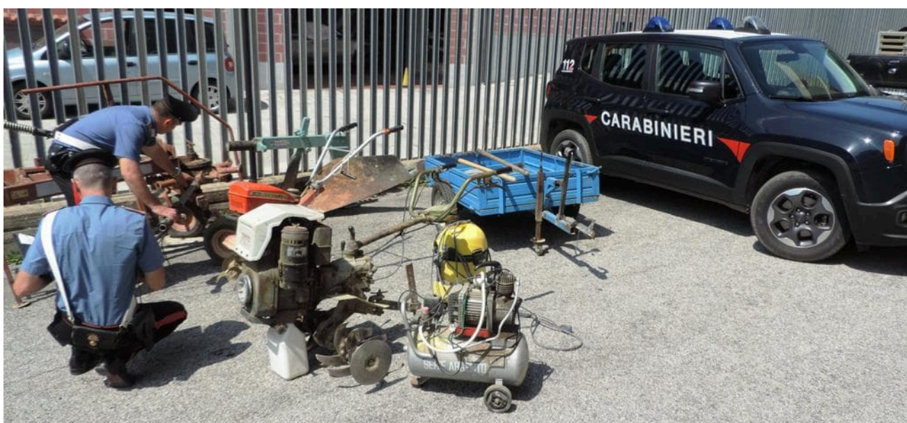
Carabinieri sequestro attrezzi agricoli