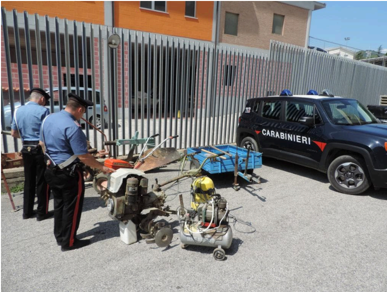
Carabinieri sequestro attrezzi agricoli

I numerosi furti di attrezzature agricole, messi a segno da ignoti nelle zone interne della provincia di Teramo, avevano destato una forte preoccupazione da parte di piccoli agricoltori. L'allarme e il disagio sociale era stato subito raccolto dalla Compagnia dei Carabinieri di Teramo che, avendo predisposto straordinari controlli e servizi, per meglio fronteggiare l'odioso fenomeno, avevano individuato i due autori.