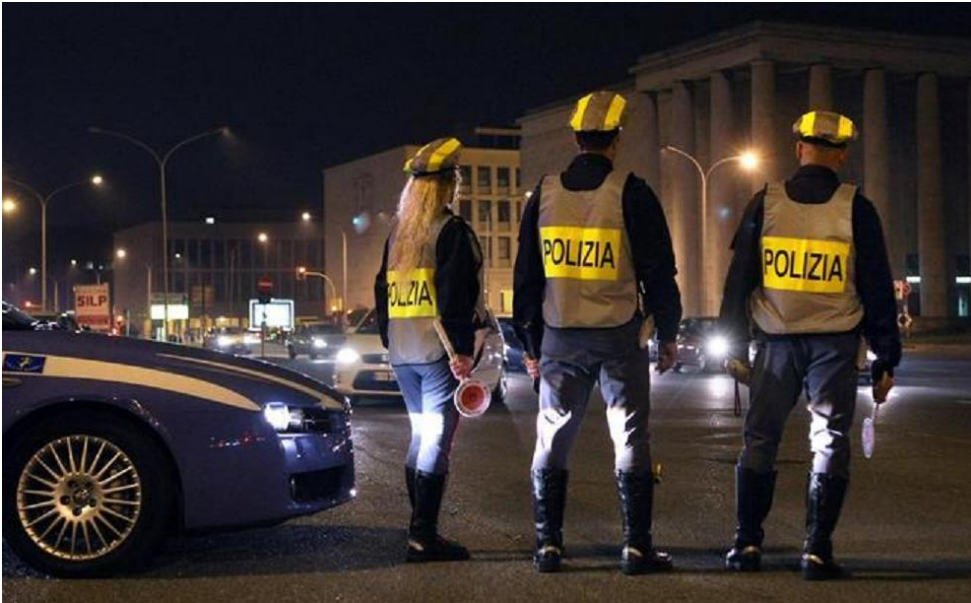
Polizia Stradale