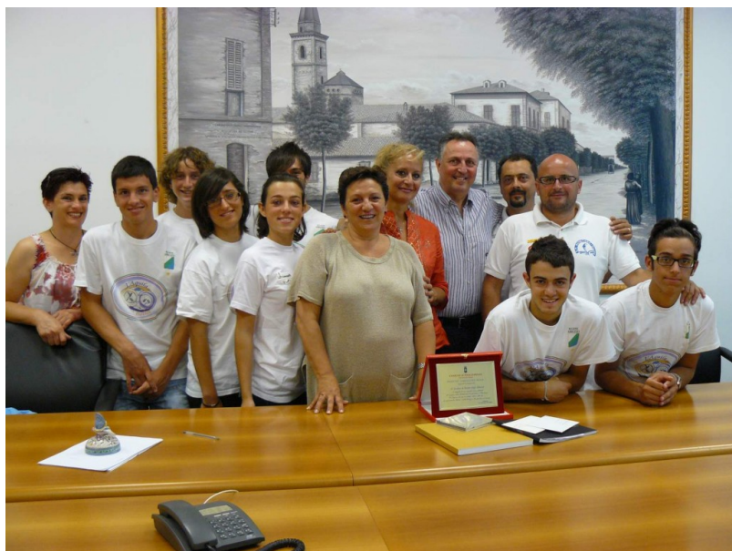
“L’Aquila nel Belice”; solidarietà e cultura

Dalle tradizioni un messaggio di speranza per la rinascita