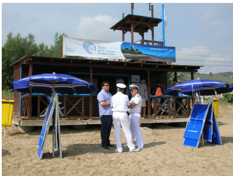
L'Area Marina Protetta Torre del Cerrano apre lo "Chalet del Parco"

Inaugurato sulla spiaggia di Torre Cerrano l'Info-Point dell'AMP