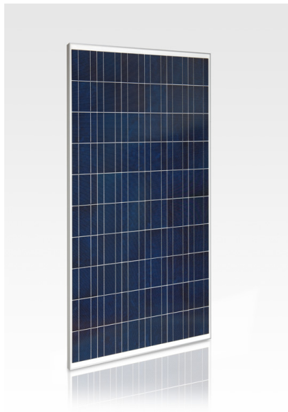
Pannelli fotovoltaici sulle scuole di Roseto