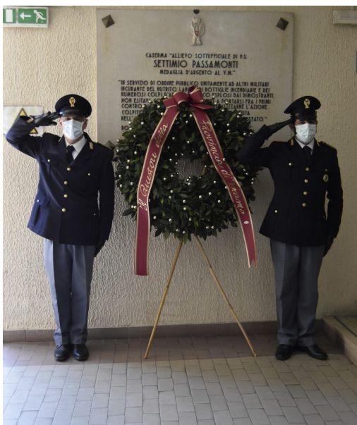
Festa della Polizia a Teramo al tempo del Coronavirus