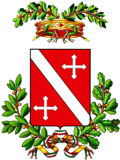
Provincia di Teramo

Teramo 9 aprile 2020. Dopo un intervento di rimozione dei massi caduti sulla provinciale 42, nel territorio di Montorio al Vomano, domani mattina la Provincia riaprirà al traffico la strada che collega il capoluogo a numerose frazioni. La strada è stata danneggiata dalle copiose piogge del 26 e 27 marzo scorso che hanno causato numerosi problemi alla rete provinciale.