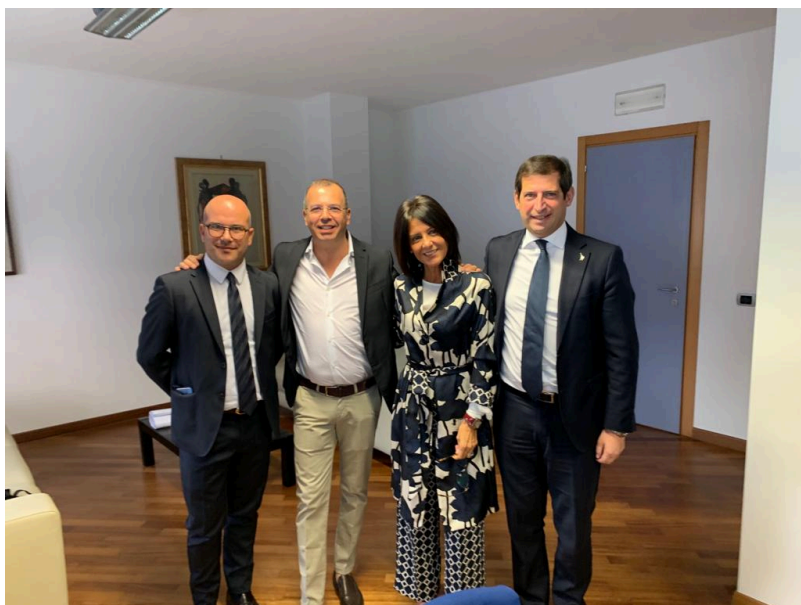
CdA ATER TERAMO

La Regione Abruzzo con legge n. 9 del 06.04.2020 pubblicata sul Bura il 07.04.2020, nell'ambito delle misure di aiuto e sostegno agli abruzzesi danneggiati dall'emergenza Covid-19, ha disposto la sospensione dell'affitto per gli inquilini ATER.