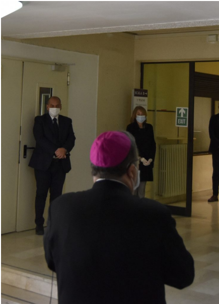
Festa della Polizia al tempo del Coronavirus 2020

Oggi, venerdì 10 aprile, ricorre il 168° anniversario della fondazione della Polizia di Stato.