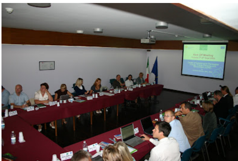
Energia solare termica, la Provincia a caccia di modelli virtuosi

Oggi e domani a Teramo il convegno di lancio del progetto europeo di cui l'ente è partner principale. La formazione degli installatori affidata alla CNA