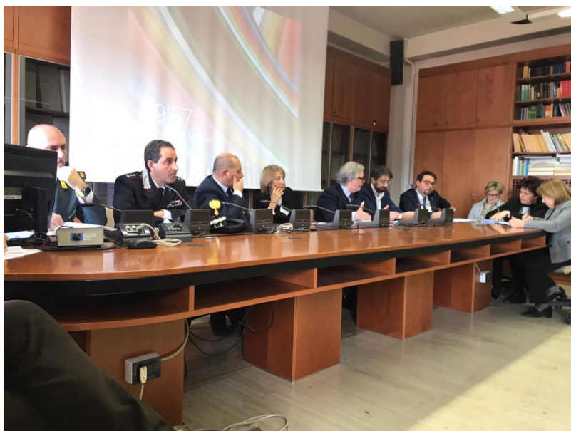
Coronavirus riunione in prefettura a Teramo

Misure preventive coronavirus: rimodulazione, al fine di evitare sovraffollamenti, degli orari di apertura al