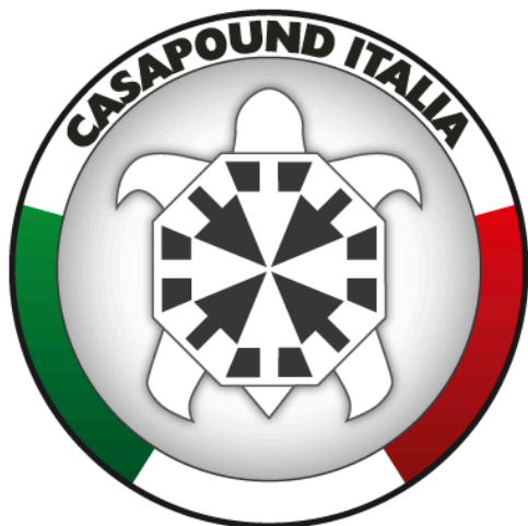
Logo Casa Pound Italia