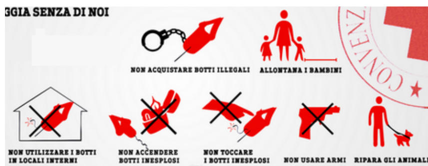
Campagna della CRI del 2017

Come ogni anno, nel corso delle festività natalizie e con l'approssimarsi della notte di San Silvestro, si intensifica l'accensione dei prodotti pirotecnici da parte dei cittadini. E' una pratica ancora molto diffusa sul territorio che, nonostante sia soggetta a rigorose norme sulla commercializzazione e sull'impiego dei prodotti, troppo spesso si svolge con modalità inappropriate e senza alcuna cautela o precauzione, tanto da determinare conseguenze spesso gravi per la pubblica e privata incolumità.