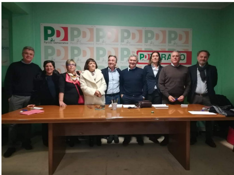
I candidati del PD della provincia di Teramo

Il Coordinamento Provinciale del PD approva la Lista con i 7 candidati teramani al Consiglio Regionale