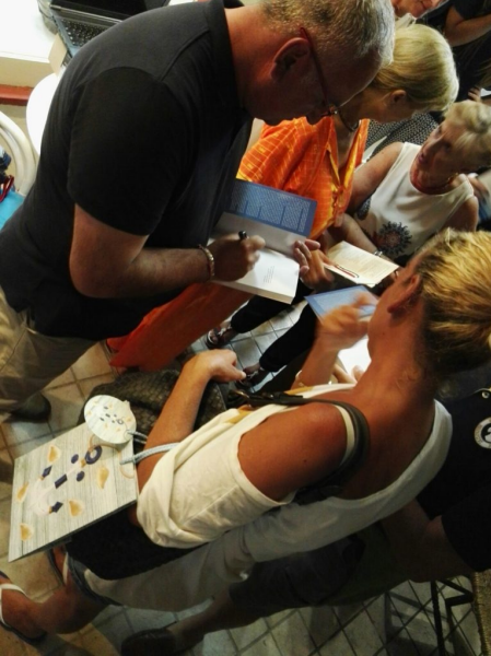
Gli autografi firmati dall'autore del libro