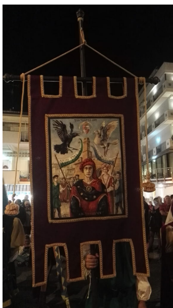
Il Drappo del Palio del Barone 2017