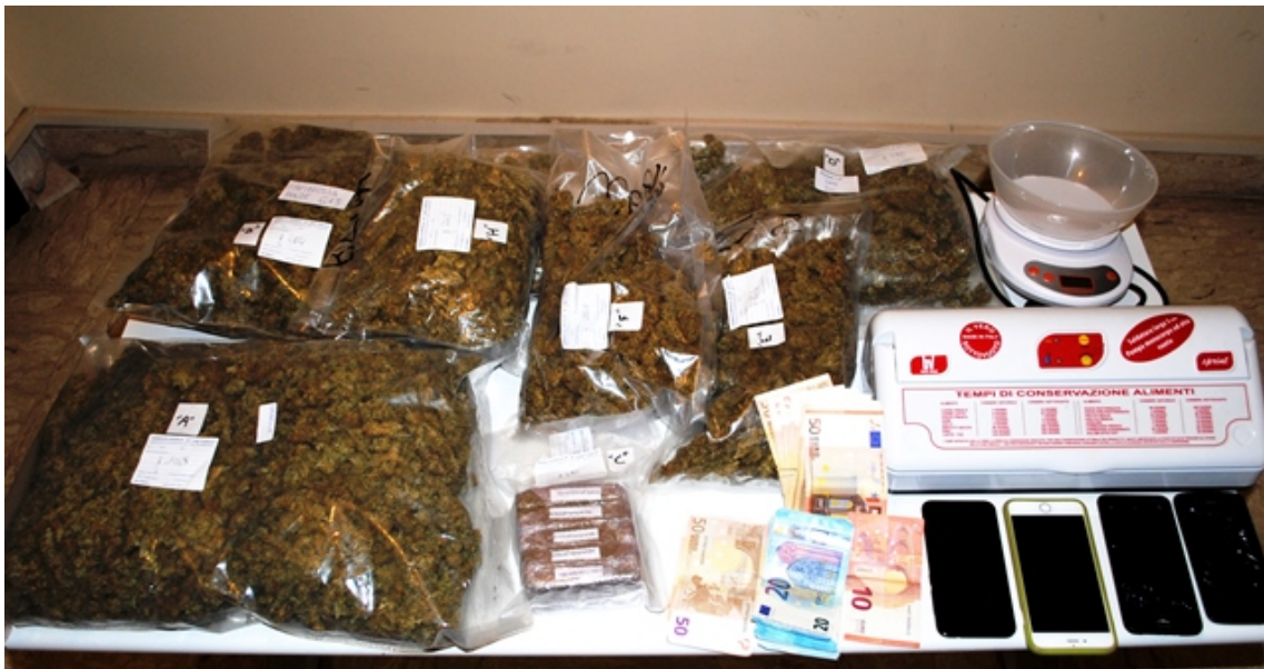
Droga - operazione Polizia a Roseto 2017

Nell'ambito dei servizi di controllo posti in essere sulla costa teramana in occasione della stagione estiva, nella giornata di ieri, personale del Commissariato P.S. di Atri ha proceduto al controllo di un'autovettura a bordo della quale viaggiavano due coppie di giovani.