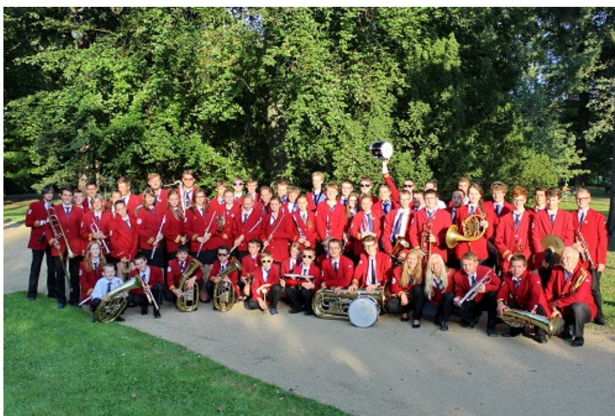
Brass band Repubblica Ceca