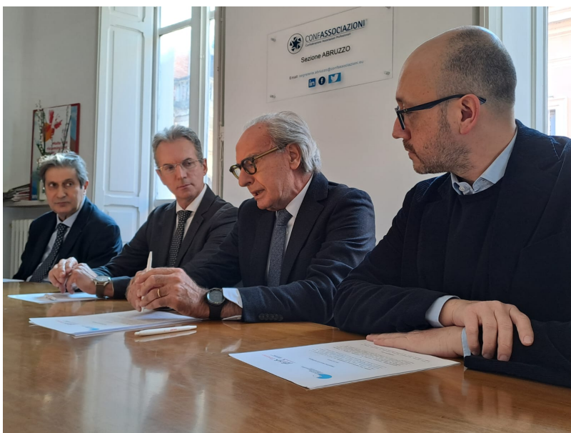
Teramo - Confassociazioni Abruzzo ha promosso la creazione di un protocollo d'intesa tra l'Ordine dei Giornalisti d'Abruzzo e l'AIL Teramo (Associazione Italiana contro le Leucemie, linfomi e mieloma) firmato stamani a Teramo dal presidente dell'Ordine dei Giornalisti d'Abruzzo