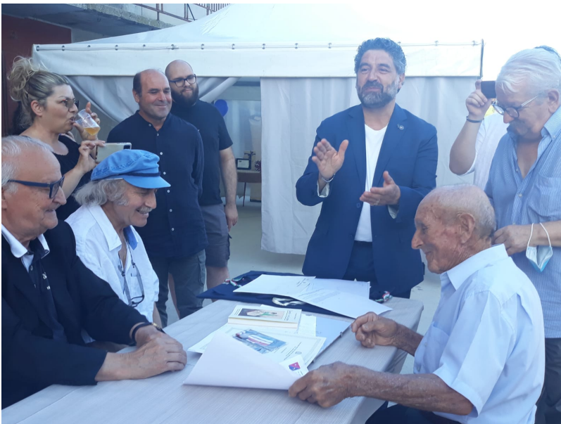
Penna Sant'Andrea, la consegna dei diplomi