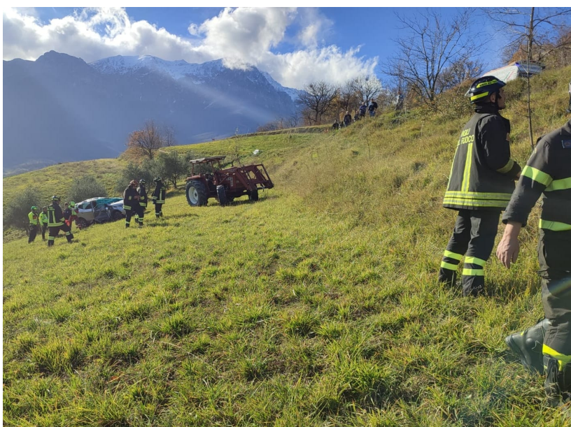
Colleccherri di Arsita