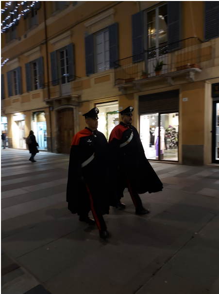
Carabinieri a piedi