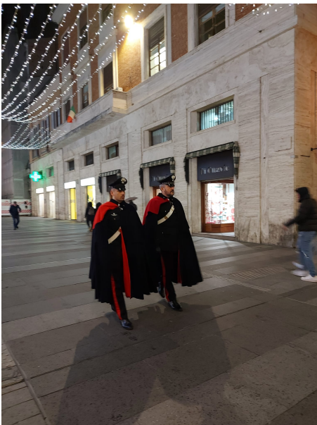
Carabinieri a piedi