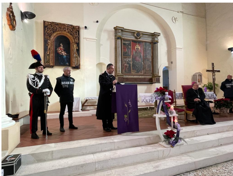
Mutignano di Pineto