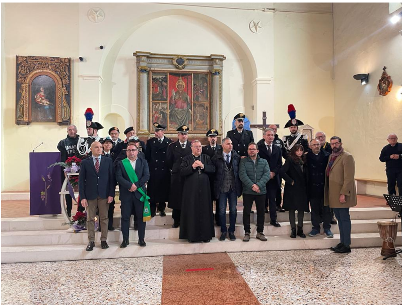
Mutignano di Pineto