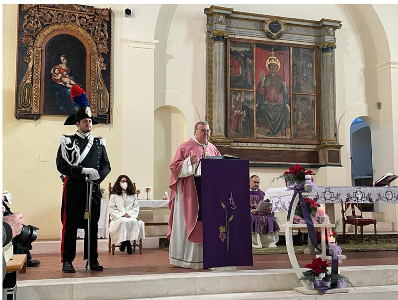
Mutignano di Pineto

Pineto. “Il San Silvestro di Mutignano” ritorna a casa. Il dipinto era stato rubato nel 2006 e recuperato dai Carabinieri nel 2016.