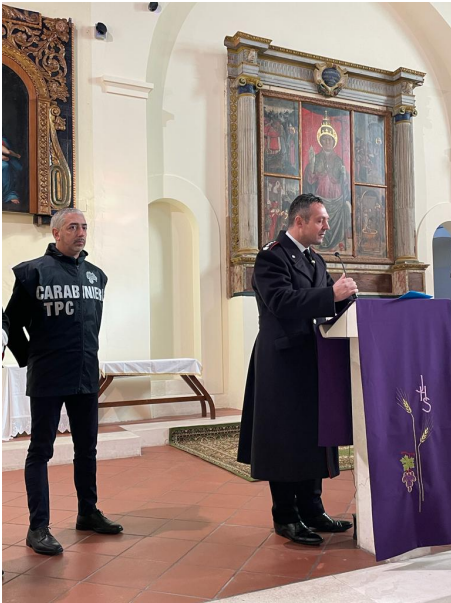
Mutignano di Pineto