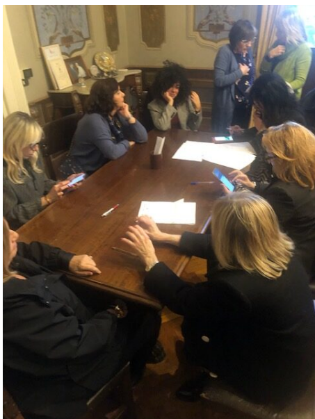
Sala Consiglio - Provincia di Teramo