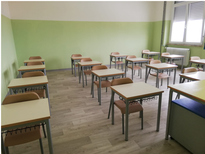
Scuola Aula

L'Istituto Tecnico Agrario Adone Zoli di Atri avvia una collaborazione con il GAL Terre d'Abruzzo