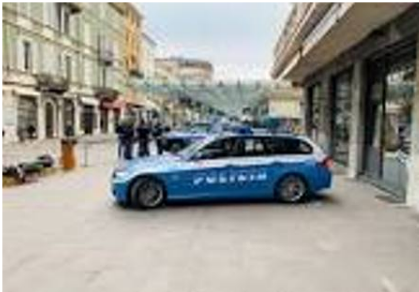
Polizia FOTO ARCHIVIO

Con preghiera di ripetuta diffusione, per ridurre al minimo i disagi alla circolazione stradale, si comunica che il giorno 10 marzo 2022 , parte del territorio di questa provincia sarà interessata dal transito e dall'arrivo della 4^ Tappa della manifestazione ciclistica denominata "57^ TIRRENO-ADRIATICO".