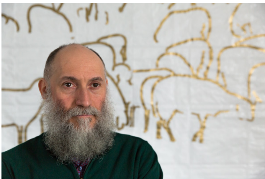
Il progetto Retina di Stefano Arienti

Abruzzo protagonista all' Italian Council con Retina , un progetto dell'artista Stefano Arienti a cura di Simone Ciglia promosso dalla Fondazione Malvina Menegaz per le Arti e le Culture - presieduta da Oswaldo Menegaz . Il progetto Retina si è classificato al secondo posto nella terza edizione del bando Italian Council (2018), concorso ideato dalla Direzione Generale Arte e Architettura contemporanee e Periferie urbane (DGAAP) del Ministero per i Beni e le Attività Culturali, per promuovere l'arte contemporanea italiana nel mondo.