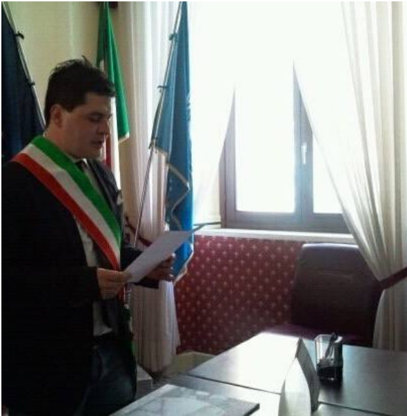
Sandro Mariani.

alloggi popolari, prevedendo una modifica dei criteri di residenza.