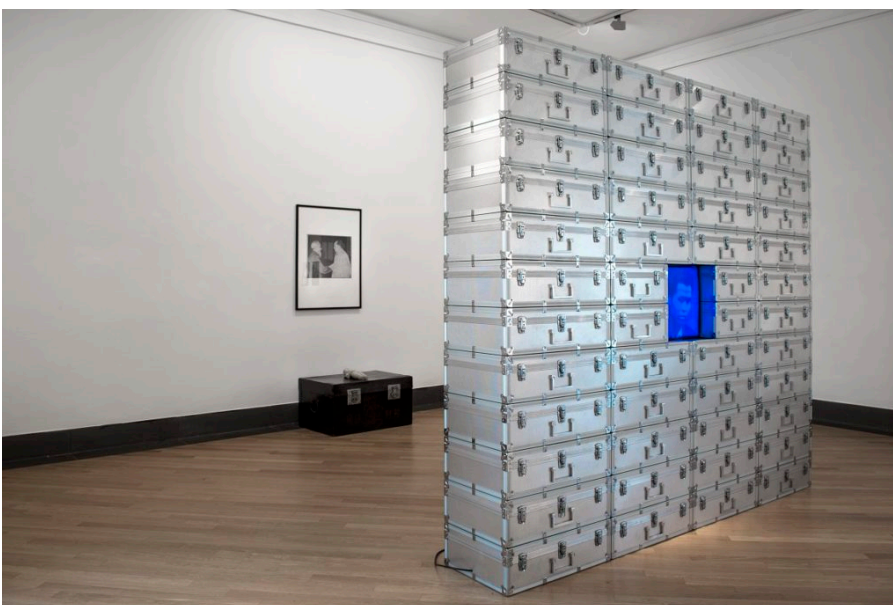
2. Cina ASIA Nuova, 1996 Veduta d'insieme

Castelbasso 2018 , propone, dal 22 luglio al 2 settembre a palazzo De Sanctis , un percorso tra le opere di Fabio Mauri che rappresentano una sintesi del pensiero dell'artista risalenti al decennio 1968-1978, alternando nelle ampie sale di palazzo De Sanctis fotografie, installazioni, proiezioni e disegni scelti dalla curatrice Laura Cherubini . Con il 1968 prende l'avvio un periodo di grandi contestazioni e creatività che, pur non realizzando una rivoluzione politica, ha però portato profondi mutamenti nella società, nella cultura, nel costume. Di quella stagione rovente Fabio Mauri è stato lucido testimone, riuscendo a mettere a punto un linguaggio - incentrato sul concetto d'ideologia - capace di esprimere la complessità politica e sociale di quel momento storico.