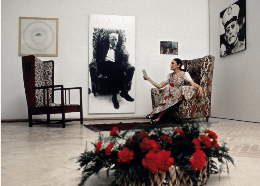
1. Dramophone, 1976 Performance Galleria Nazionale d'Arte Moderna e Contemporanea, Roma 1994

Castelbasso 2018 , propone, dal 22 luglio al 2 settembre a palazzo De Sanctis , un percorso tra le opere di Fabio Mauri che rappresentano una sintesi del pensiero dell'artista risalenti al decennio 1968-1978, alternando nelle ampie sale di palazzo De Sanctis fotografie, installazioni, proiezioni e disegni scelti dalla curatrice Laura Cherubini . Con il 1968 prende l'avvio un periodo di grandi contestazioni e creatività che, pur non realizzando una rivoluzione politica, ha però portato profondi mutamenti nella società, nella cultura, nel costume. Di quella stagione rovente Fabio Mauri è stato lucido testimone, riuscendo a mettere a punto un linguaggio - incentrato sul concetto d'ideologia - capace di esprimere la complessità politica e sociale di quel momento storico.