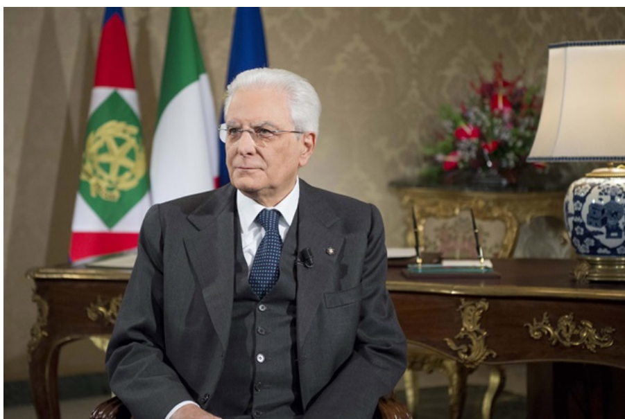
Il Presidente Mattarella

Questa mattina, nel corso di un incontro presso la Prefettura di Teramo, i rappresentanti dell'Osservatorio Indipendente sull'Acqua del Gran Sasso hanno consegnato al Prefetto una lettera indirizzata al Presidente della Repubblica.