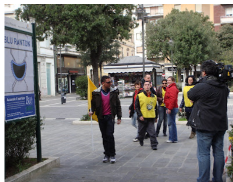
Trofeo Tartaruga: il più lento è l'autobus. Ancora allarme Pm10, Pescara al limite dei superamenti.

Pescara, 22 febbraio 2010 - In occasione della campagna sull'inquinamento atmosferico "Mal'Aria", Legambiente Abruzzo ha organizzato questa mattina il Trofeo Tartaruga, l'appuntamento annuale che registra i tempi di percorrenza nella città di Pescara.