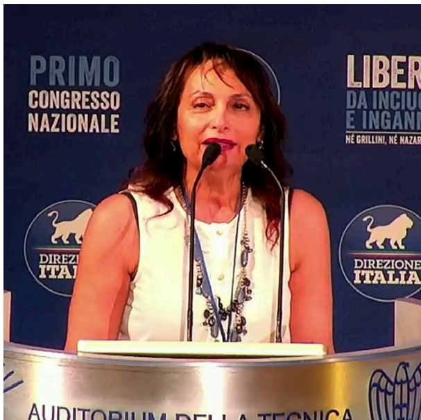
foto Congresso Del Giovine 2

L'europarlamentare pugliese Raffaele Fitto , e' stato proclamato all'unanimita' da una gremiissima platea Presidente del neonato partito :Direzioe Italia.