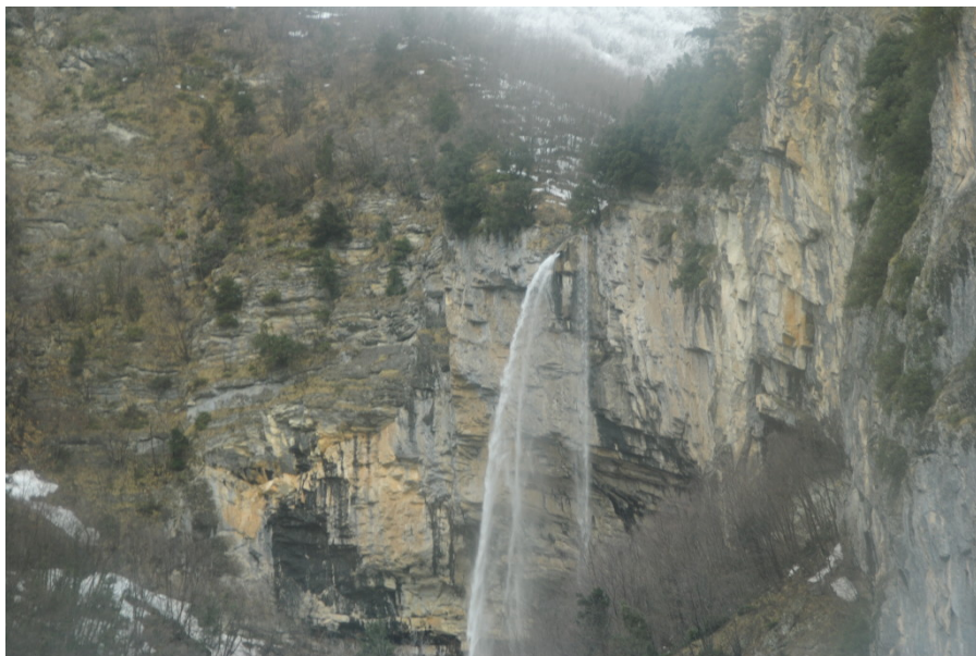
Ruzza Acqua Gran Sasso