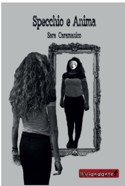
Specchio e Anima