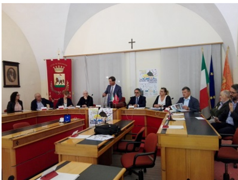
conferenza stampa festival internazionale bande musicali 2017