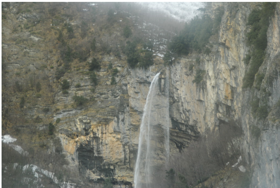
Gran Sasso