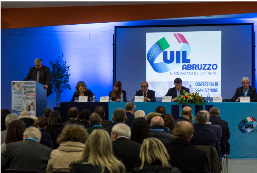
Congresso UIL Abruzzo a Avezzano

Il passaggio del testimone c'è stato stamattina a Sulmona, nel corso della conferenza d'organizzazione intitolata “Facciamo il sindacato più forte” , alla quale hanno partecipato circa trecento delegati e numerose personalità, a partire dal segretario generale della Uil Carmelo Barbagallo . La nomina di Lombardo è stata votata all'unanimità.