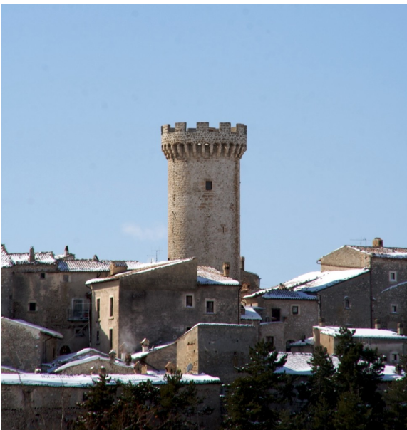
Torre Medicea di Santo Stefano di Sessanio