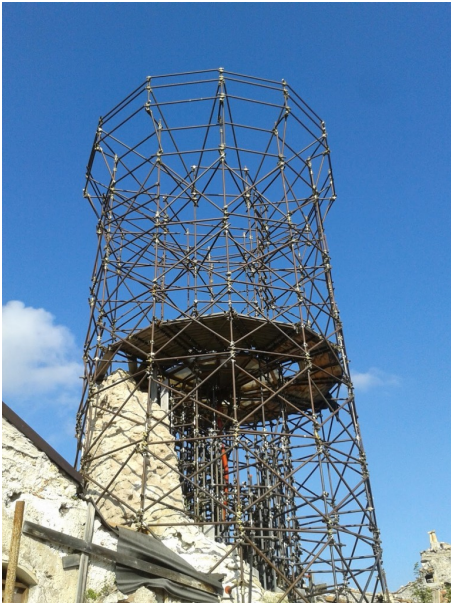
Torre Medicea di Santo Stefano di Sessanio