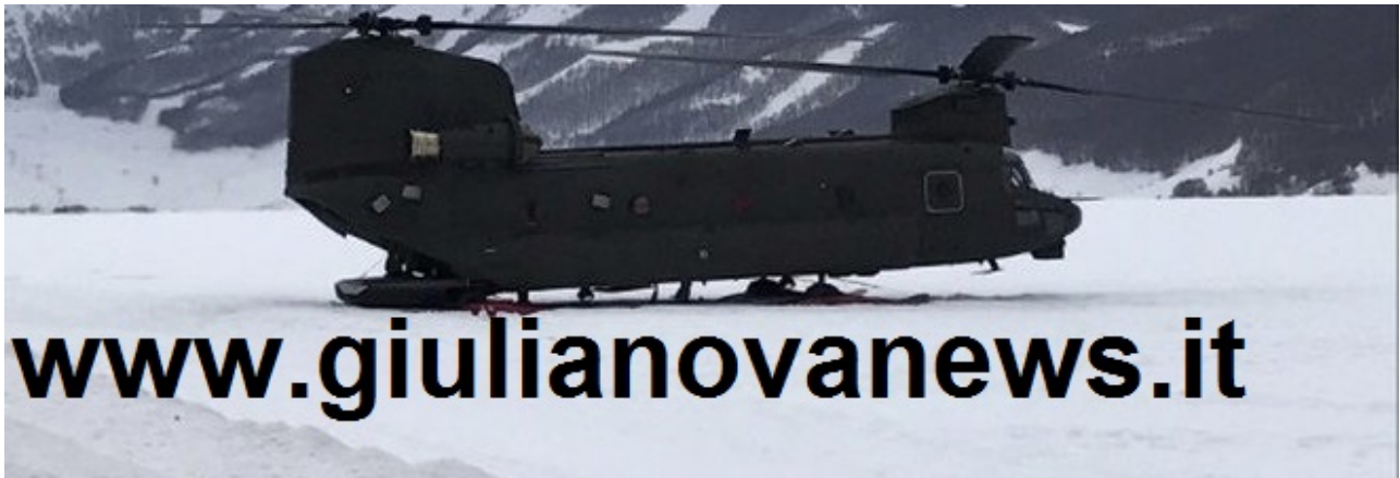
dell'elicottero Agusta AW139

A seguito della richiesta formulata dalla Procura di L'AQUILA, il giorno 4 febbraio si è proceduto alla rimozione e al recupero del relitto dell'elicottero Agusta AW139 del 118 precipitato il giorno 24 gennaio u.s. in un canalone nel corso del salvataggio di uno sciatore romano di 57 anni infortunatosi sulle piste da sci di Campo Felice in provincia di L'AQUILA.