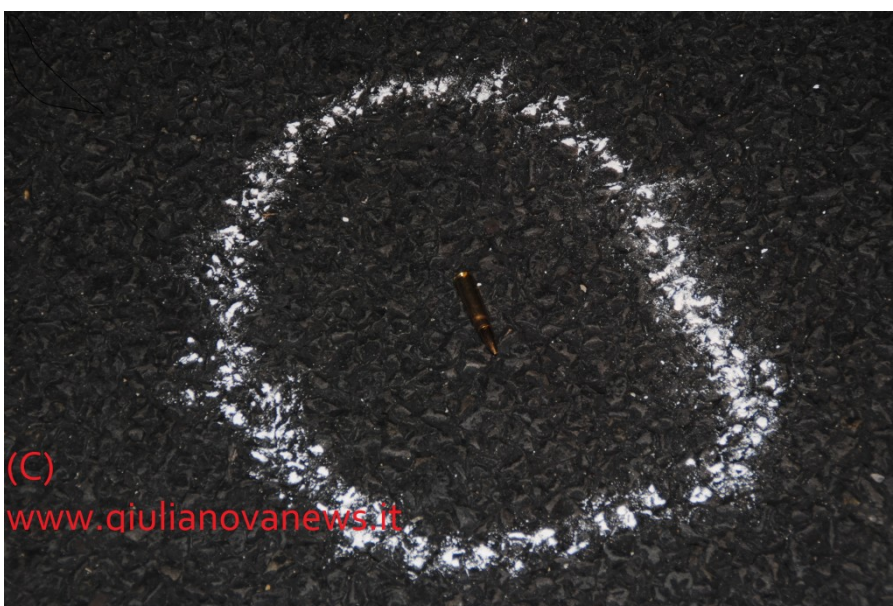
Giulianova, 2 giugno 2016. Erano quasi le 23,00 di ieri sera quando un commando di 6/7 persone hanno tentato di rapinare un furgone portavalori della Fitist di Jiesi con circa 1,8 milioni di Euro.